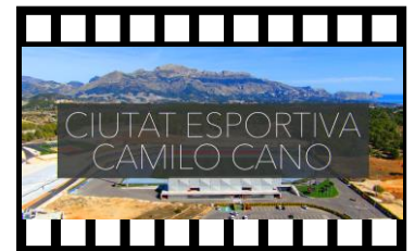
CIUTAT ESPORTIVA CAMILO CANO LA SERRETA ALTA * LA NUCÍA, ALICANTE

Prestigioso galardón concedido a La Nucía por 2ª vez en el Parlamento de Bruselas por ACES Europa. Merecido reconocimiento por su compromiso en la promoción del deporte.