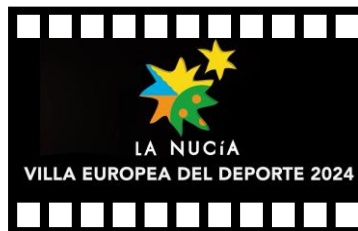
LA NUCÍA VILLA EUROPEA DEL DEPORTE 2024

"La Nucía, Ciudad del Deporte", Primer destino deportivo inteligente del mundo, con un gran calarío de eventos deportivos de ámbito nacional e internacional.- vídeo 12 min.