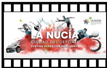
LA NUCÍA *CIUDAD DEL DEPORTE

VILLA EUROPEA DEL DEPORTE 2013 // 2024 concedido por Aces Europa